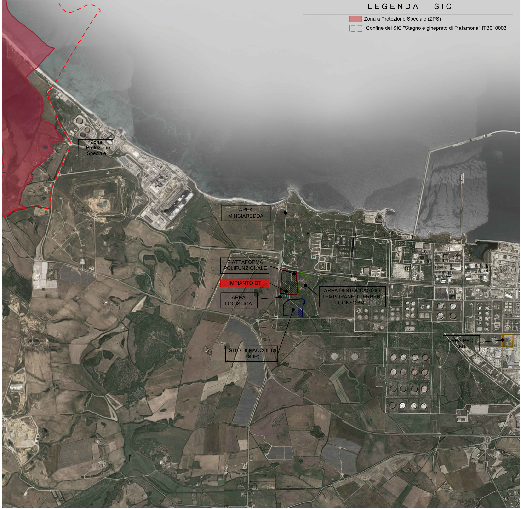
Ortofoto dei Siti di Interesse Comunitario e Zone a Protezione Speciale limitrofe - Scala 1:25000