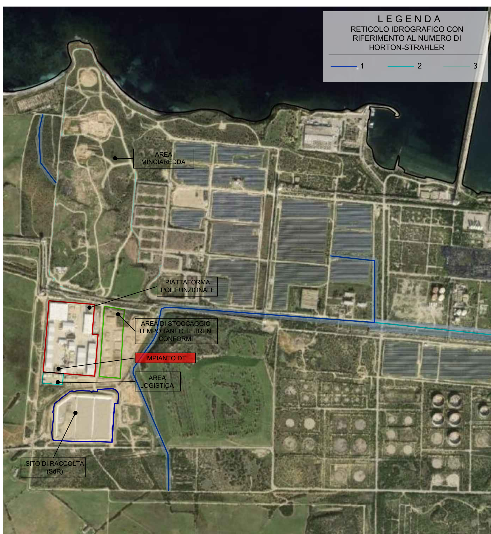
Stralcio PAI (piena 30 ter) - Scala 1:20000