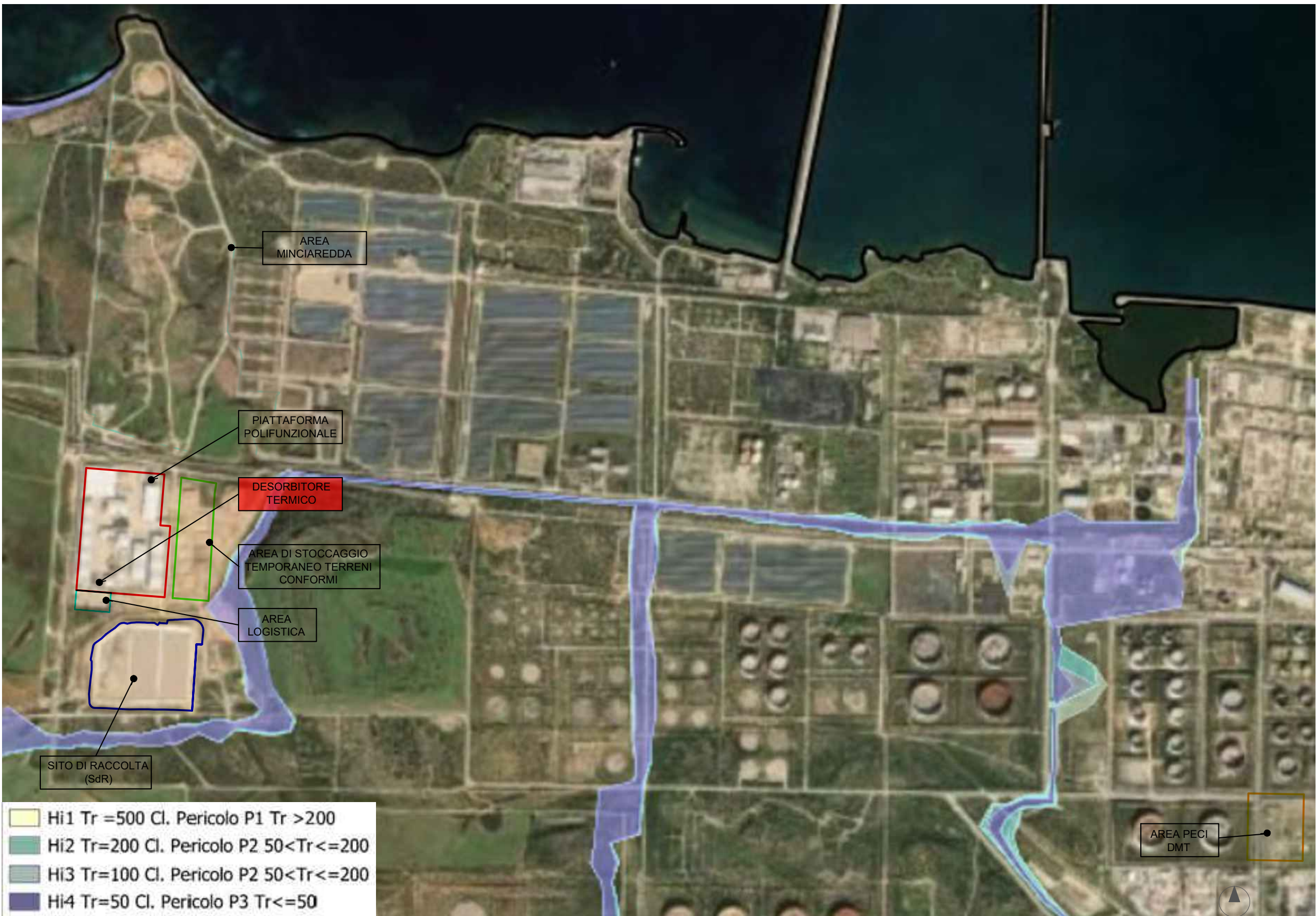
Stralcio del Piano di Gestione del Rischio di Alluvione - Scala 1:10000